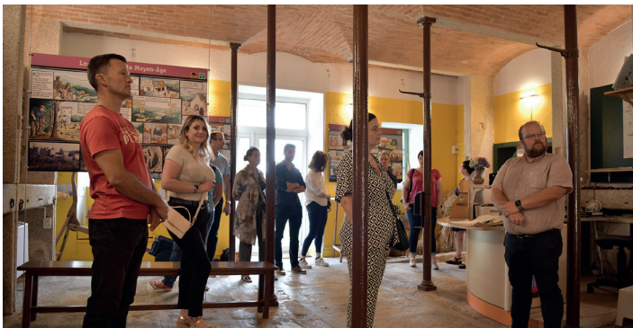
Un musée richement doté.