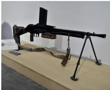
Une importante collection pour la Mémoire...