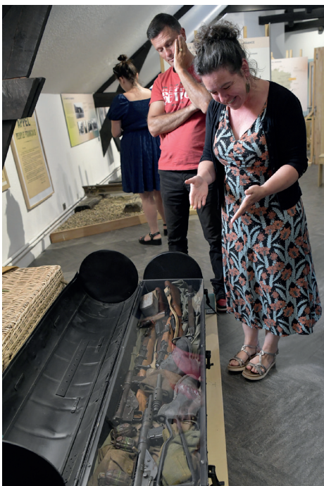
Parachutage de matériel militaire.