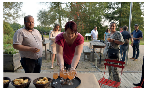
Jus de pommes pressé au Parc et gougères maison.