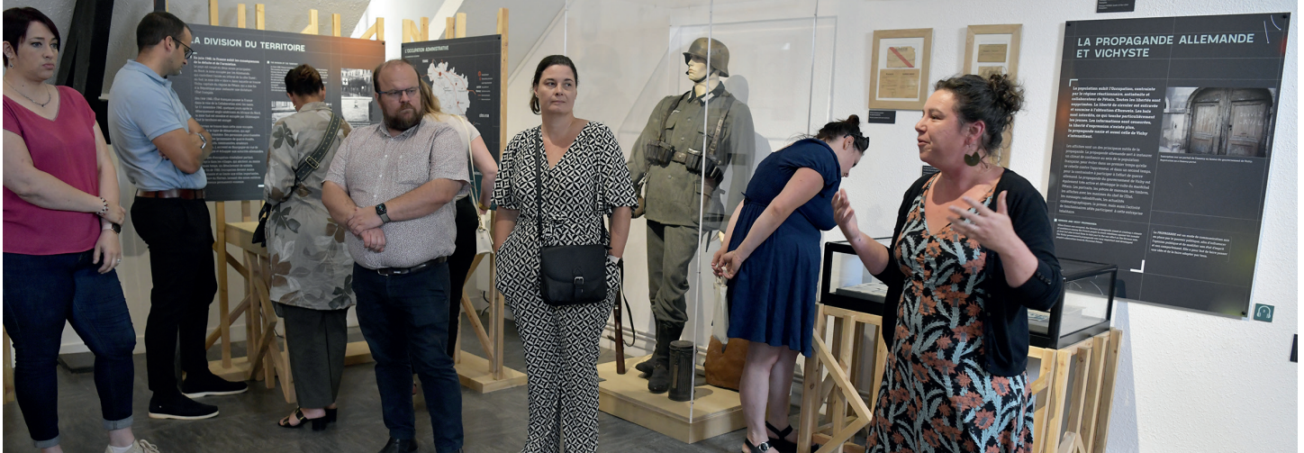
Une quinzaine d'adhérents était présente lors de cette visite. La première salle sur l'Occupation aborde le sentiment patriotique et la défense du Morvan en 1940.