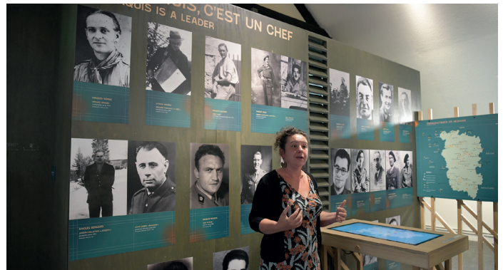
Hommage aux maquis et à leurs chefs.