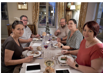
À l'issue de la visite, repas servi au Bistrot Loiseau du Morvan