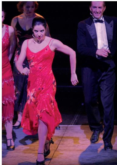
En spectacle en tant que soliste claquetteuse dans "Folies" avec Broadway Musical Company au Japon