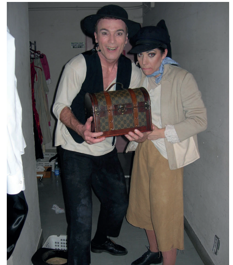
Dans les coulisses prêt pour faire un extrait de la comédie musicale « Oliver » avec Broadway Musicale Company au Japon