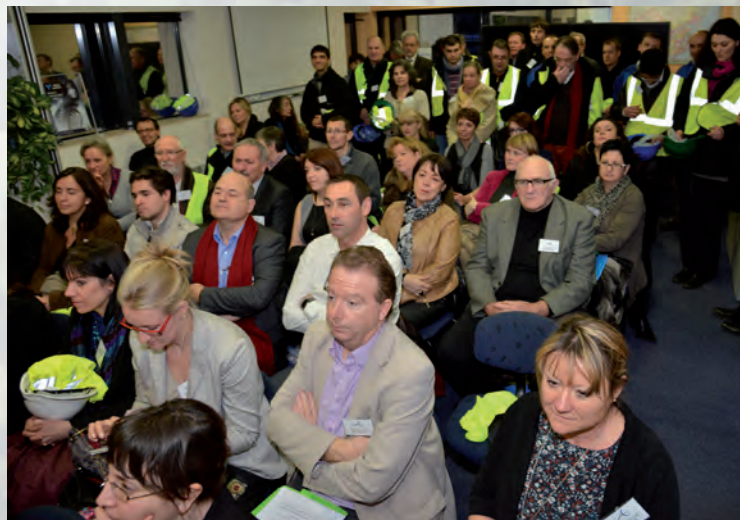
Soixante personnes présentes à la première plénière de l'année 2014 du club

La sécurité est une priorité absolue. L'amélioration continue des compétences des équipes est très ancrée au sein du groupe. Ce dernier a mis en place une politique de développement durable structurée. Vallorec adhère au Pacte Mondial des Nations Unies.