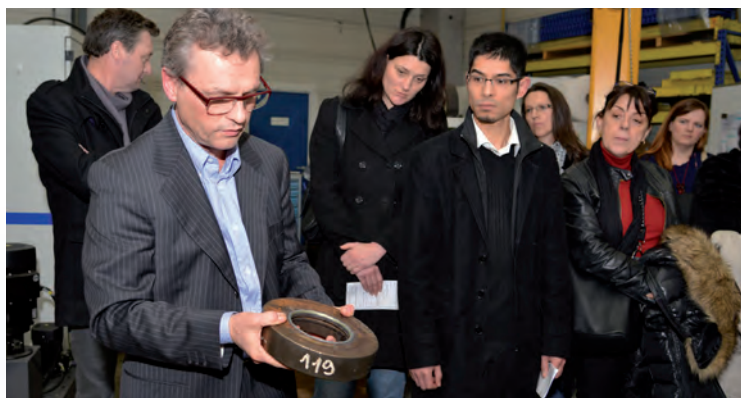
MEIRS s'est vue délivrer son premier brevet en 2008 ; elle est à l'origine de nombreuses améliorations validées et standardisées