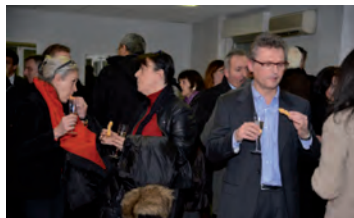
Un temps d'échange très convivial