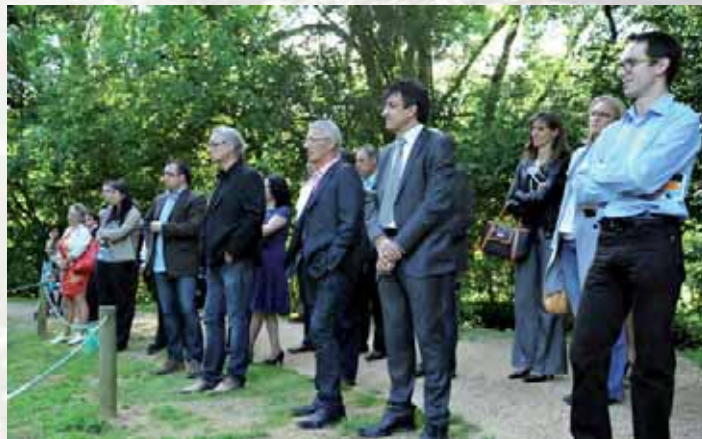
Une trentaine de personnes ont participé à la plénière au parc de l'Auxois mi-juin