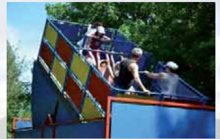
Le Parc de l'Auxois est aussi parc de loisirs et d'attractions, ainsi que parc aquatique