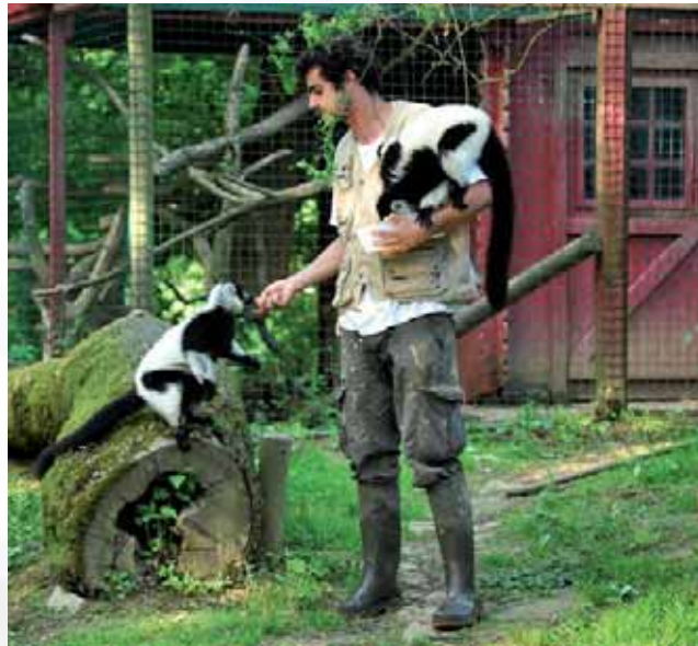
Quelles menaces pèsent sur les lémuriens ? La peau du serpent est-elle visqueuse ? Comment s'organise une meute de loups ? Une pléiade d'informations sur les animaux du parc est dévoilée au public lors de goûters et d'animations pédagogiques