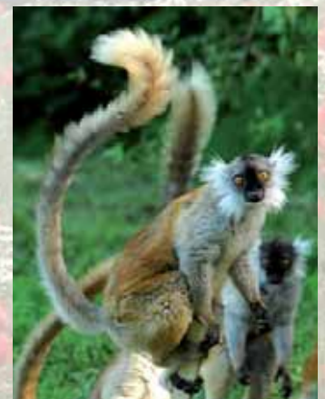
Ici, le biotope de chaque catégorie d'animal est scrupuleusement respecté