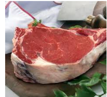
Abattu en Bourgogne