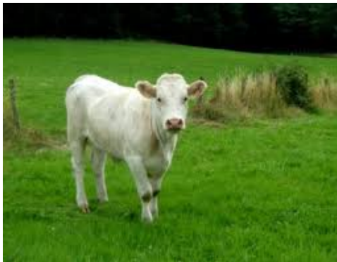
né en Auxois Morvan