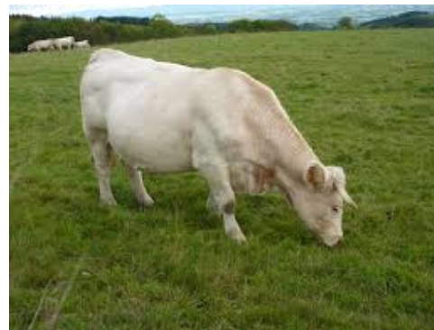
élevé en Auxois Morvan