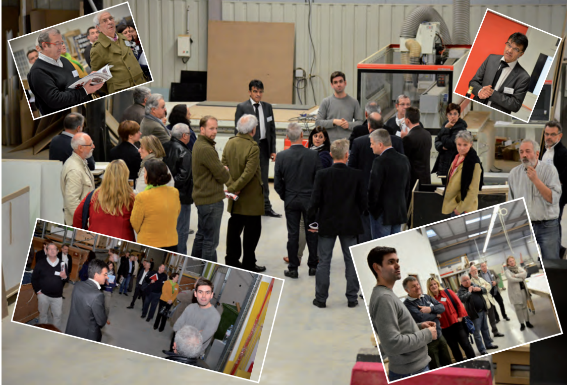
Une trentaine de personnes ont visité les locaux de Panel Stand lors de la dernière plénière du club des Entrepreneurs de l'Auxois