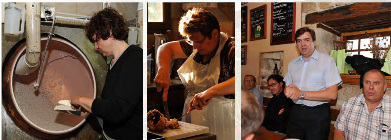
Un bien bon bonbon fabriqué par trois générations de Troubat