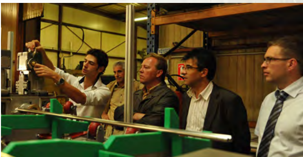
La société Provea à Venarey-Les Laumes, hôte de la plénière de juin. Au programme, conférence de l'association « Histoire de vie » et visite de l'atelier, suivies par plus de 20 adhérents