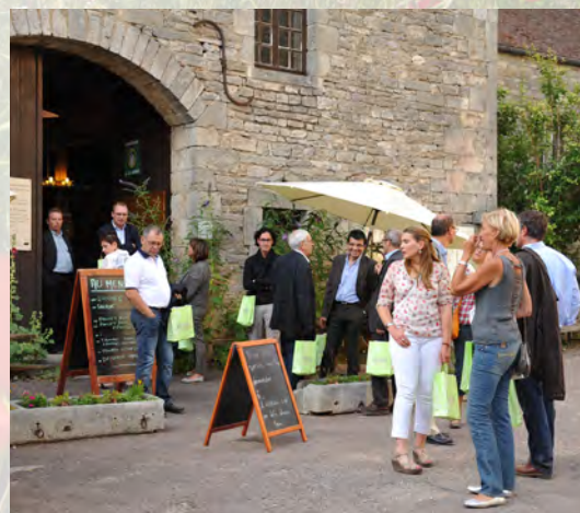
Repas servi à « la Grange » à Flavigny