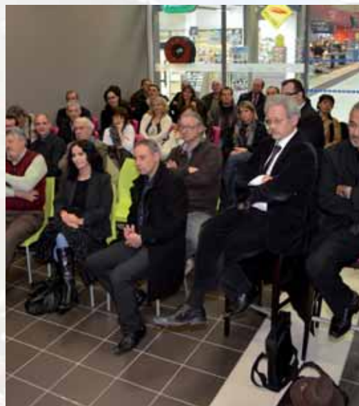
Plus de 40 adhérents ont assisté à cette visite d'Intermarché