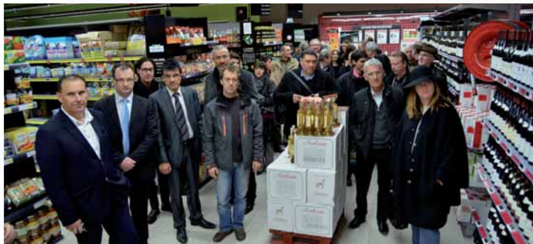
Le magasin Intermarché à Montbard a une superficie de 3 000 m 2 , emploie 60 salariés et son objectif est de développer l'offre non alimentaire (bricolage, art de la table, textile...). Son objectif vise 20 M€ à échéance de 2 à 3 ans. Le centre commercial de la Côte dont il est le commerce phare réunit 8 autres commerces pour une surface totale de 10 000 m 2