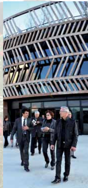
Une visite unanimement appréciée