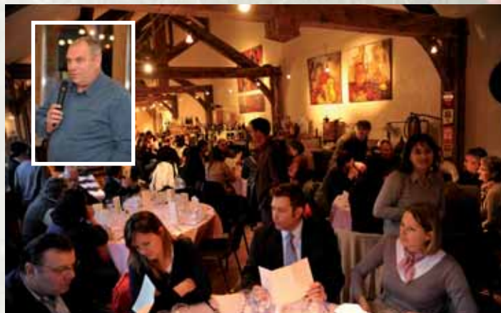
Le repas a été servi au vignoble de Flavigny-sur-Ozerain. Il réunissait Entrepreneurs de l'Auxois et ceux du Châtillonnais, invités pour l'occasion