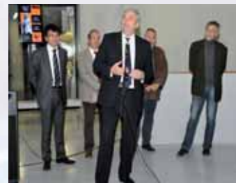
Accueillis par François Sauvadet, président du conseil général