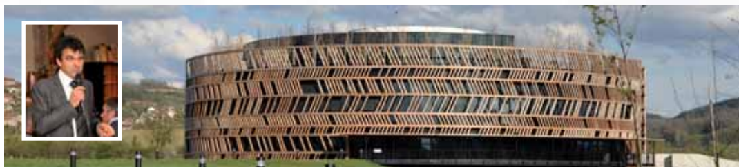
Le centre d'interprétation du Muséoparc a été inauguré le 22 mars et a ouvert ses portes le 26