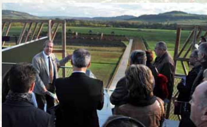
Arrêt sur la terrasse végétalisée qui forme un belvédère offrant un panorama à 360° sur le site du siège d'Alésia. Ici, le parcours est rythmé par un dispositif signalétique expliquant l'emplacement des camps, des lignes de fortifications césariennes...