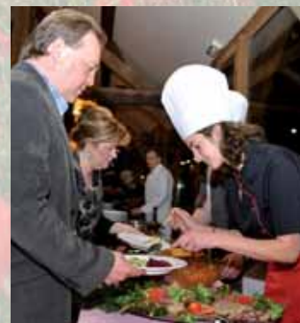
Au menu, dégustation des vins de Flavigny, et un riche buffet préparé par le chef de l'Auberge de l'Âtre de Quarré-les-Tombes